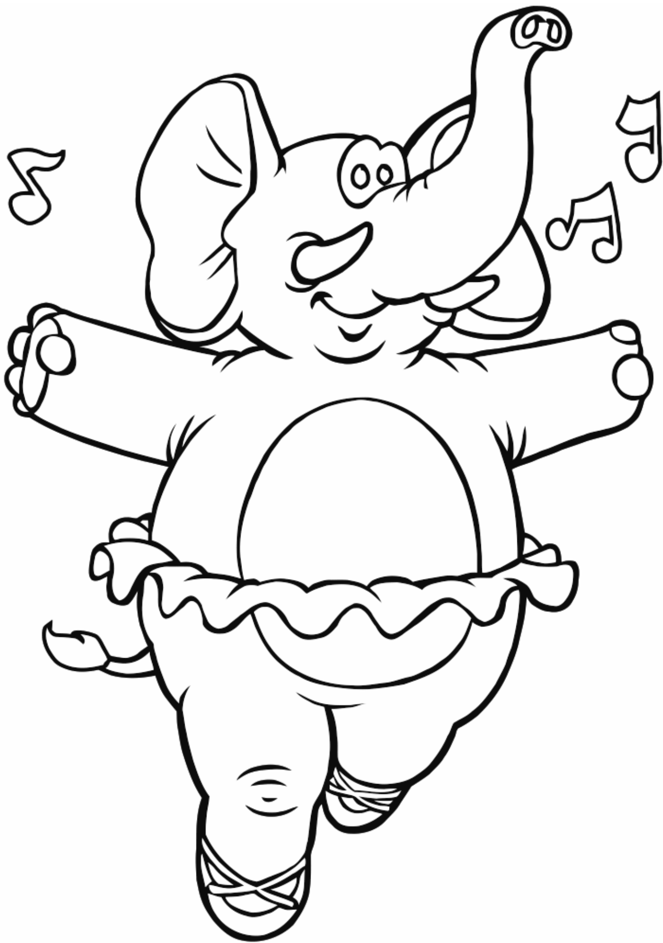
положение танцовщицы ПОЗА